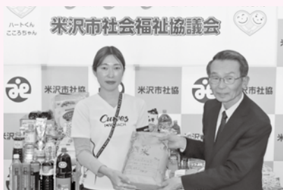
◆カーブス米沢大町 様