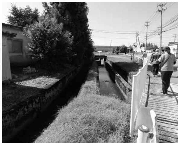
午前中はみんなでまちを歩き、情報を集めます