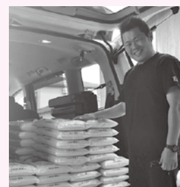
◆有限会社 富士屋商店 様