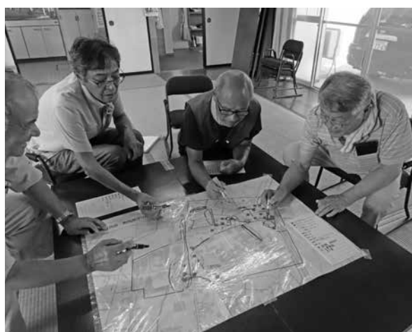
午後はまち歩きで得た情報をマップに落とし込みます

社会福祉協議会では、町内会で活用していただける「町内見守り防災マップ作成」のお手伝いをしておりますので、多くの方に興味を持っていただければと思います。