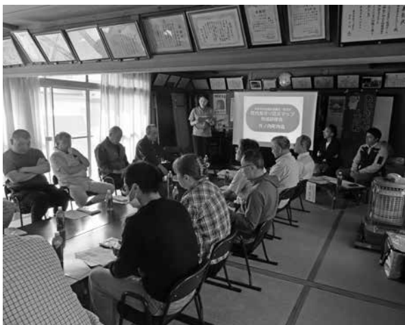
はじめに町内見守り防災マップについて説明します

午前中は住民の皆さんと町内を歩き、危険箇所や浸水想定箇所の他、一人暮らし高齢者宅や日中独居宅、空き家などの情報を集め、午後はまち歩きで得た情報を地図に落とし込み、さらには、「支援を必要とする世帯」や日頃から見守りや声かけをしてくれる「支援をしてくれる世帯」の情報も盛り込んだマップを作成しました。