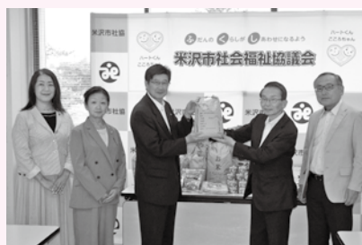
◆米沢市農業委員会有志一同 様