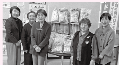
◆国際ソロプチミスト米沢 様