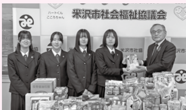
◆山形県立米沢東高等学校 様