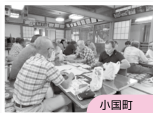
小国町町内会さん

～板谷でこれからも穏やかに暮らすために～そんな思いから、権利擁護の制度の一つである成年後見制度について学びました。