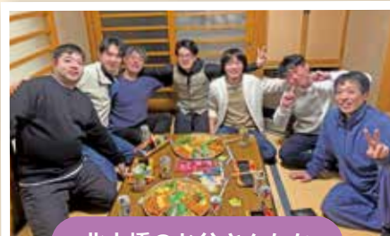
北土橋のお父さんたち

子どもたちに町内の良さを伝えながら、自分たちも楽しんでいます。そんなお父さんたちの普段のつながりをご紹介します。