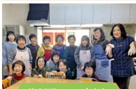
住之江町のママ友たち

子どもたちが巣立ったあとも長くつながっているママ友たちのエピソードをお伝えします。