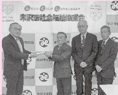
◆ 米沢市グラウンド・ゴルフ協会 様