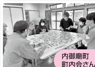
内御廟町町内会さん