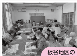
板谷地区のみなさん