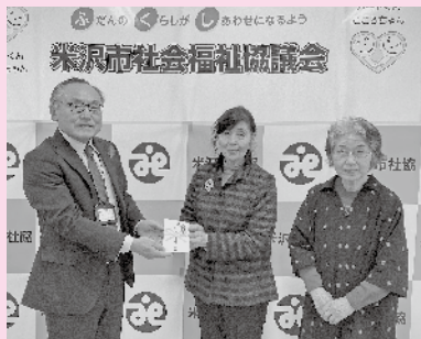
◆ 表千家まこと会 様