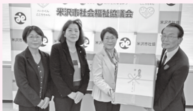
◆米沢法人会 女性部会 様