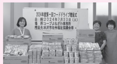
◆生活協同組合共立社コープよねざわ 様