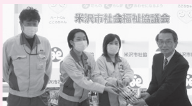
◆AGC ディスプレイグラス米沢(株) 様