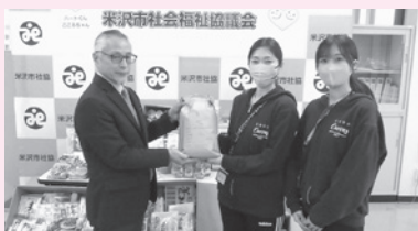
◆カーブス米沢大町 様