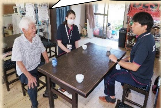
いづみ養老店訪問

集まりがない時は、畑や釣り堀に忙しくしているよ。畑は 7畝。見るか？よかったら野菜も持っていかか？