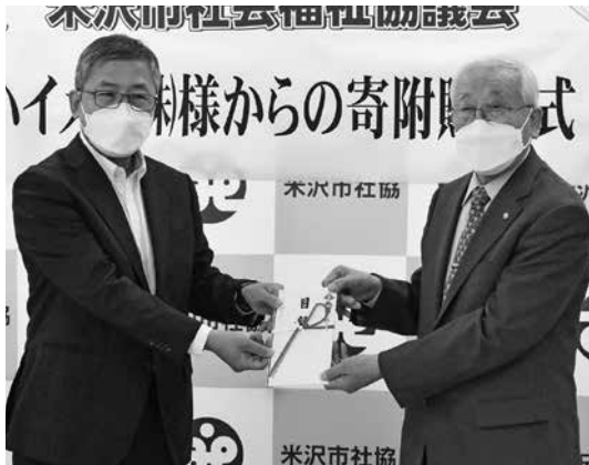
◆ハイメカ株式会社 様