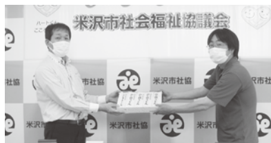
◆生活クラブやまがた生活協同組合 様