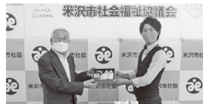
◆東洋羽毛北部販売(株) 福島営業所 様