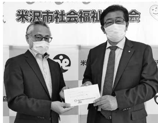
◆米沢市内4ロータリークラブ 様