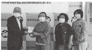
◆国際ソロプチミスト米沢 様