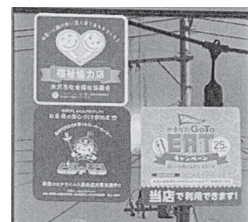
入り口付近にステッカーを貼ってもらっています。