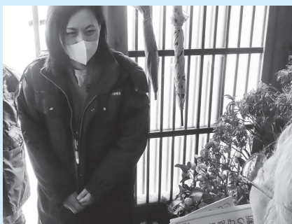
～見守り訪問の様子～