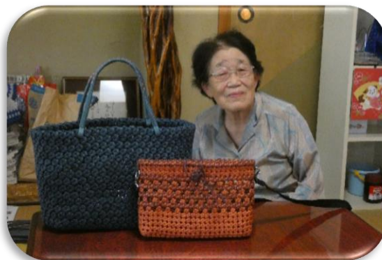
おしょうしなの会のマドンナ的存在 ✨ 笑顔が 加(・∀・)!! 1方でした。