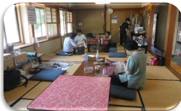
いろいろな物を作っています。 入口のところで作品の販売もしています。 ぜひ、一度見に来てください。