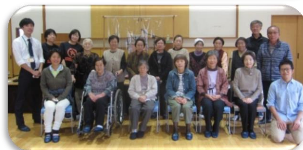
月1回開催し、いつもみなさん楽しみに参加してい ます。みんなで元気に歌ったり、笑顔で大笑いした り、軽体操で体を動かしたりと、活動は様々です。