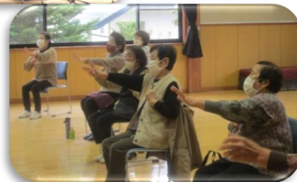
みんなで体操！ ワン、ツー♪ ワン、ツー♪