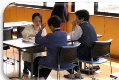
栄養についての勉 強を行いました。 これで健康寿命も 延びるよね～♪